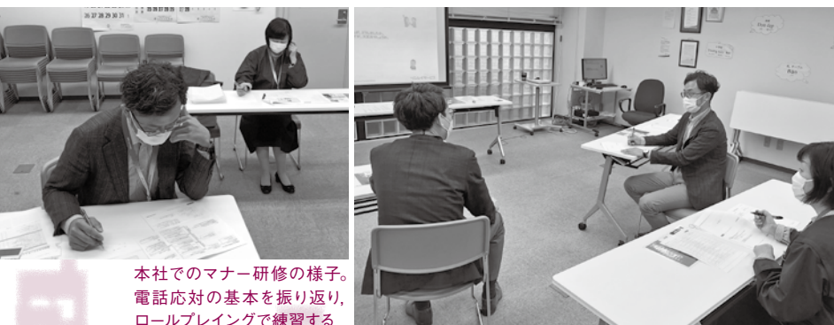
本社でのマナー研修の様子。 電話対応の基本を振り返り、 ロールプレイングで練習する