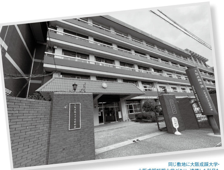
同じ敷地に大阪成蹊大学・大阪成蹊短期大学があり、連携した科目も