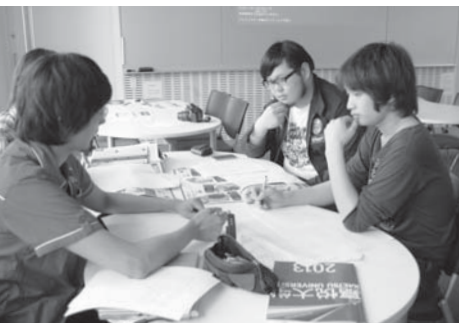
政治家などにインタビューを行い、出版社の雑誌WEBサイトで掲載(プロジェクト科目出版ビジネス)