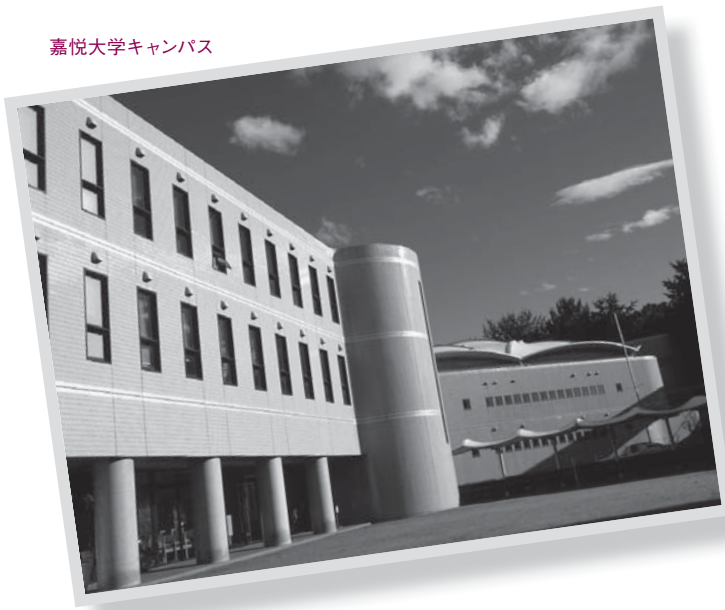
嘉悦大学キャンパス

学生は2年次からビジネス・ユニット(BU)とアカデミック・ユニット(AU)に分かれる。BUの学生は2年次から企業での実習を繰り返し、AUの学生は学内での活動を中心に企画・立案に関する学びを深めることが目標となる。いずれにしても、実際に社会に出て働く現場を意識し、経営やマネジメント、会計といった大学での知識科目が実際にはどう生かされ